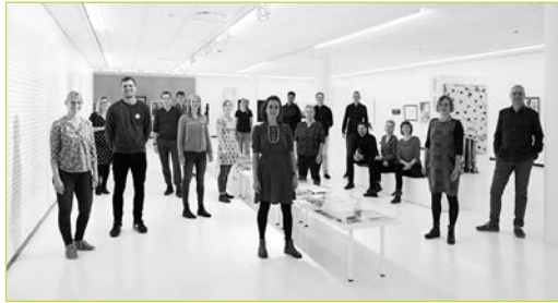
Team von matrix architektur