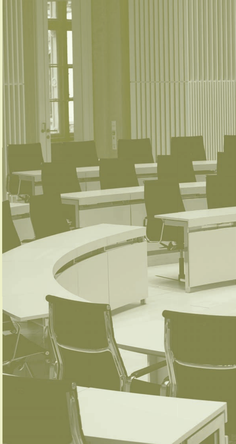
Foto: Plenarsaal des Landtages Mecklenburg-Vorpommern im Schloss Schwerin Landesbaupreis M-V 2019 in der Kategorie „Bausumme ab 1 Million Euro“ Architektur: Dannheimer & Joos Architekten GmbH

Architektenkammer Mecklenburg-Vorpommern Alexandrinestraße 32 | 19055 Schwerin Telefon 03 85 5 90 79-0 | Fax 03 85 5 90 79-30 info@ak-mv.de | www.ak-mv.de