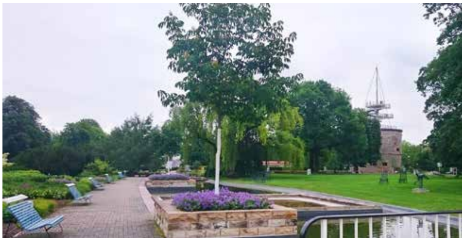
Die Ansicht der Wasserachse im Erfurter egapark mit rekonstruiertem Wasserbecken, aber veränderter Pflanzung.

Text: Enno Meier-Schomburg, Landschaftsarchitekt, Mitglied des BDLA / Landesverband M-V